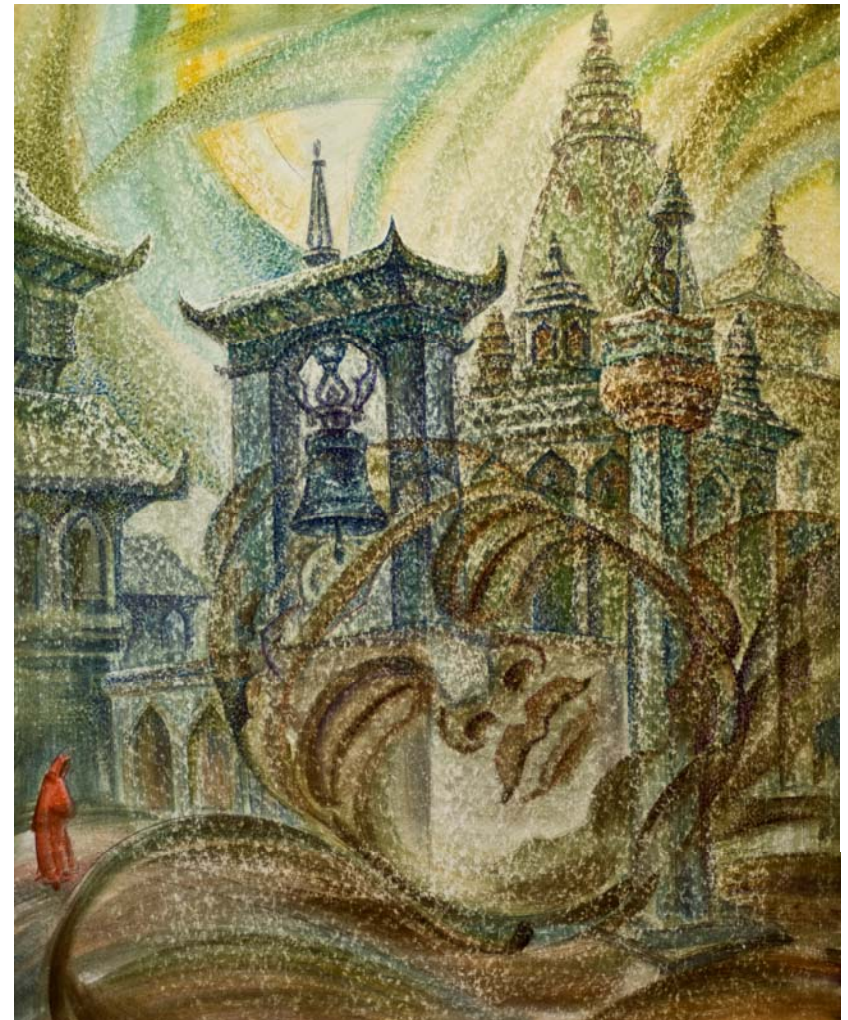
Сон Будды. Акварель. 2009 г.

Неоднократный дипломант Международных конкурсов акварельной живописи, участник всесоюзных, московских и зарубежных выставок. Картины автора находятся во многих музеях России и за рубежом (Японии, США, Германии, Великобритании, Франции и др. странах).