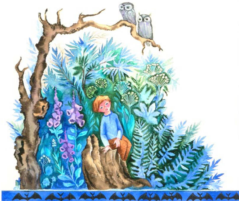
В. Нестайко «В стране солнечных зайчиков». Из-во «Радуга». Москва