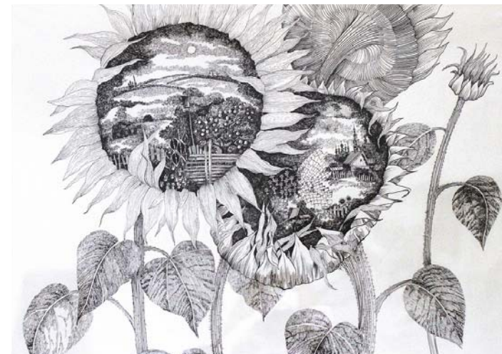
Подсолнухи. Тушь, перо