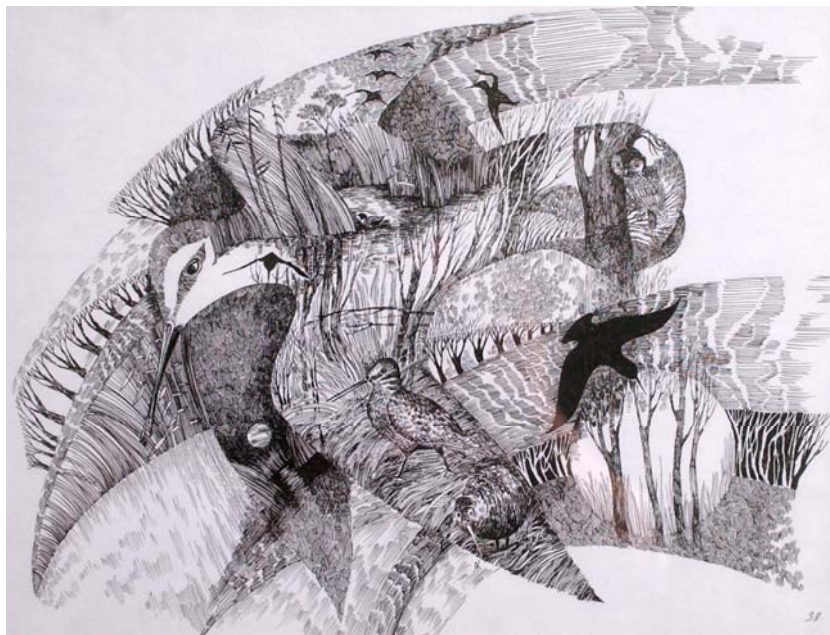
Вальдшнеп. Тушь, перо, бумага