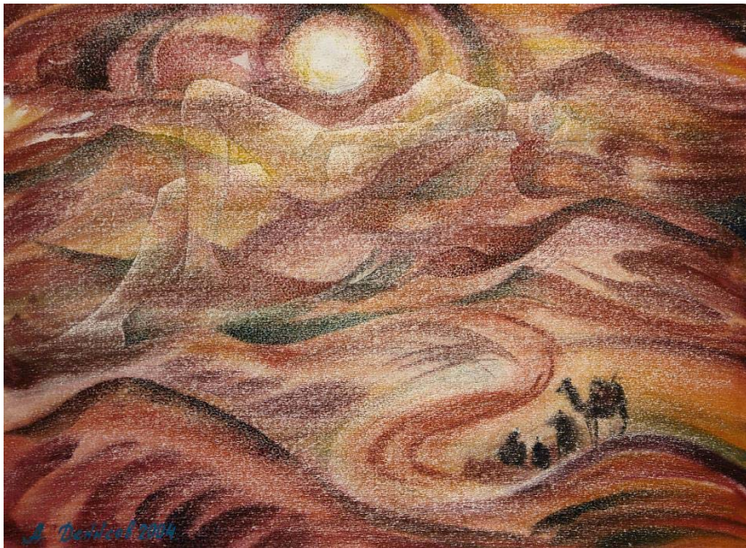
Мираж. Акварель. 2004 г.