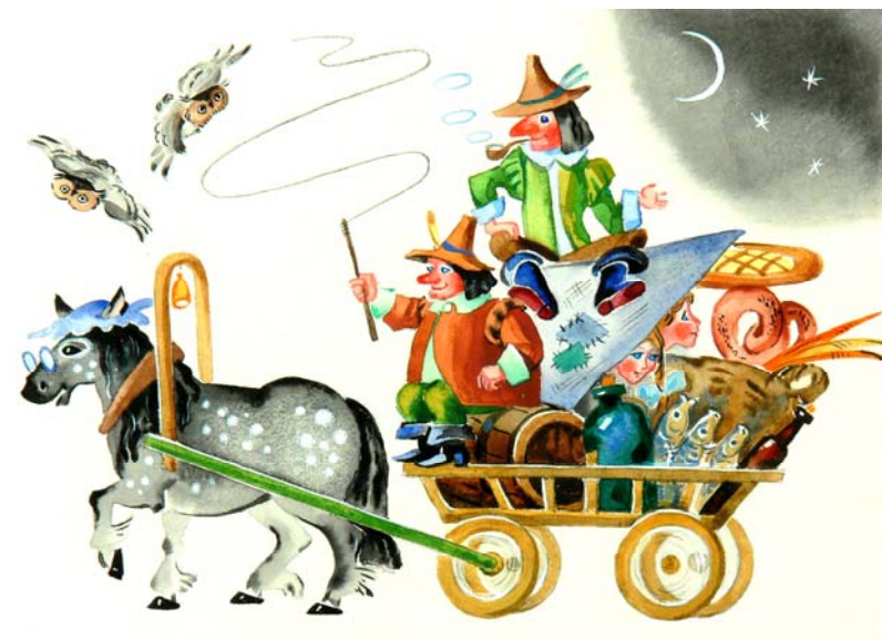
Н. Губарев «Королевство кривых зеркал». Из-во «Махаон». Москва

Неоднократный дипломант Всесоюзного конкурса книги, дипломант конкурса акварельной живописи. Участник международных, всесоюзных, московских и зарубежных выставок; в том числе Международной биеннале пастели, Испания (2011, 2013 г.), Международной биеннале пастели, Франция (2012 г.). Работы находятся в музеях нашей страны и частных коллекциях России, Италии, Германии, Японии, США, Финляндии, Норвегии, Бельгии, Франции.