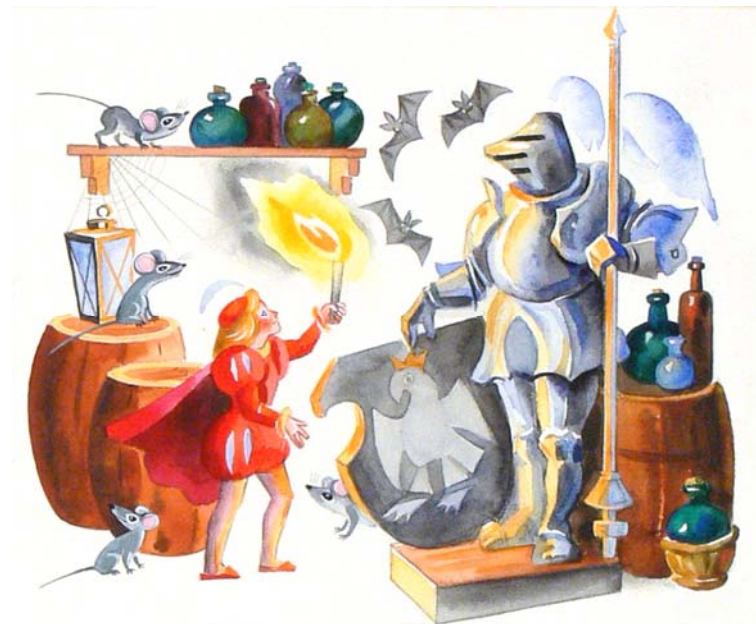
Н. Губарев «Королевство кривых зеркал». Из-во «Махаон». Москва